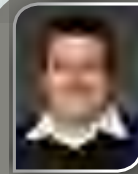
Kristoffer Engbo, toimituspäällikkö, DIGIKUVA